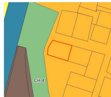
Карта границ территорий, предусматривающих требования к архитектурно-градостроительному облику объектов капитального строительства